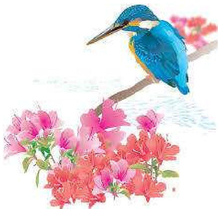
翡翠(カワセミ):糸魚川市の鳥